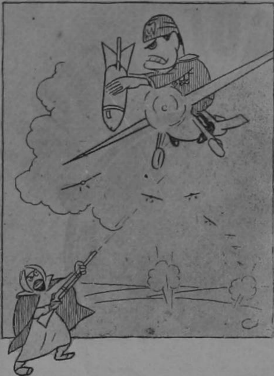
—¡Aspeta! ¡Vieco Amico! Hácame el favore de dejarme tirar cuesta bombina, pero sin tirarme osté en la palanqueta de la reculata!